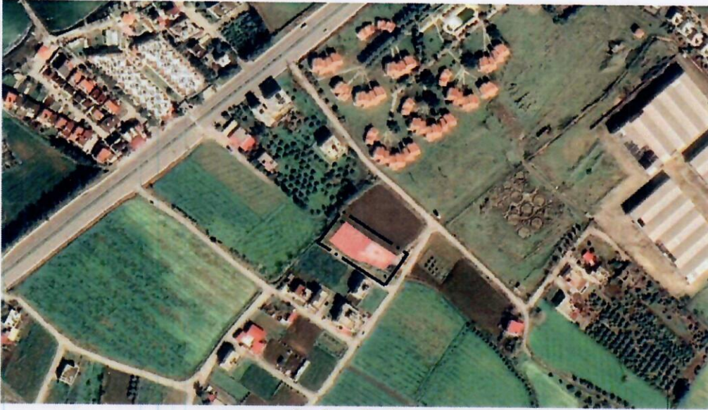
UYDU GÖRÜNTÜSÜ (GOOGLE)

Planlaması yapılan alan, Arsuz ilçesine bağlı Madenli mahallesi sınırları içerisinde bulunan P35a05c1b no.lu Uygulama İmar Planı paftasında ve 1999 ada 4 no.lu parsel üzerinde bulunmaktadır. Söz konusu parsel 1458m 2 büyüklüğünde ve arsa vasfında olup şahıslar mülkiyetindedir.