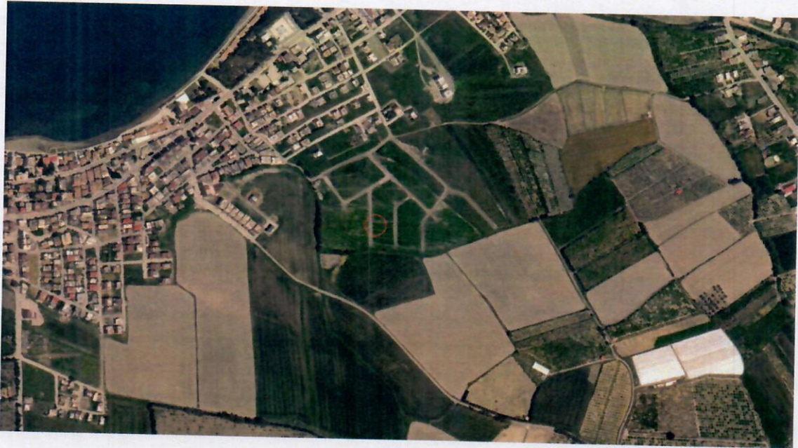
Harita 1: Plan Değişikliği Alanının Uydu Görüntüsü

Bahse konu plan değişikliği alanı TKGM' de Alakop Mahallesi sınırları içerisinde Cumhuriyet Caddesinin güneyinde Menekşe Sokağın kuzeyinde yer almaktadır. Planlama alanı, 1/1000 ölçekli hâlihazır haritalarda, P35B08C3B paftasında kalmaktadır.