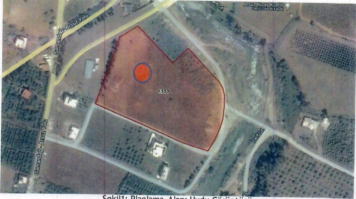
Şekil1: Planlama Alanı Uydu Görüntüsü

Planlama alanı tapusunda Hatay İli Arsuz İlçesi Arpaçiftlik Mahallesi 1313 Parseldir. Planlama tapu alanı 20.351,49 sahip olup arsa vasfındadır. (Şekil1)