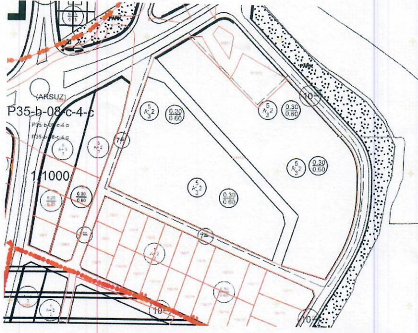
Şekil4: 1/1.000 Ölçekli Uygulama İmar Planı Değişikliği Öneri Paftası